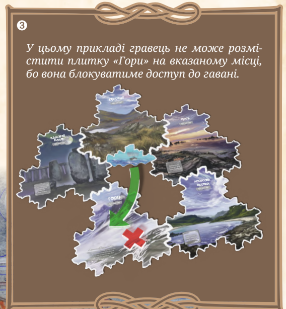
У цьому прикладі гравець не може розмістити плитку «Гори» на вказаному місці, бо вона блокуватиме доступ до гавані.