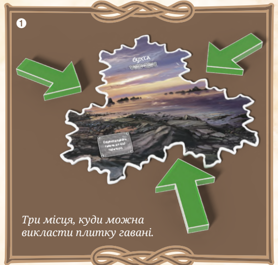
Три місця, куди можна викласти плитку гавані.

Коли клани переміщуються морем, території з плитками гаваней вважають сусідніми.