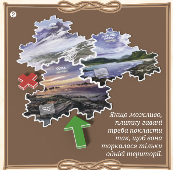
Якщо можливо, плитку гавані треба покласти так, щоб вона торкалася тільки однієї території.