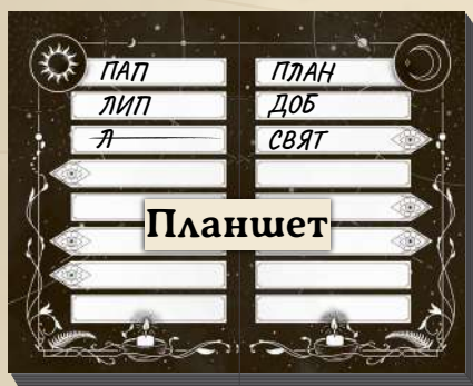
Сторона сонячної команди

Медіуми однієї команди мають спільну колоду карток, працюють разом і можуть ділитися таємними примітками. Кожен із них може промовити «Silencio».