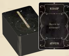
100 карток із запитаннями