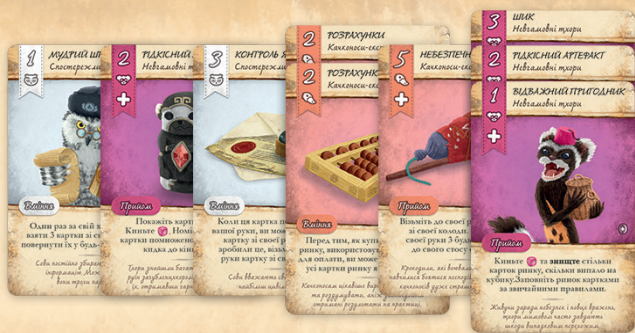
Приклад прилавку гравця, на який викладено перші 6 стосів товарів

належать до одного народу звіряток і мають відповідну суму номіналів, та викладіть їх перед собою на свій прилавок. Стоси товарів викладають горілиць у стовпчик, а картки у них зсувають так, аби було видно номінали усіх карток. Ви не можете викласти незавершений стос товарів, щоб потім додавати до нього картки.