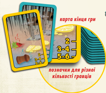
карта кінця гри